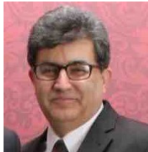
سخنران قسمت دوم برنامه